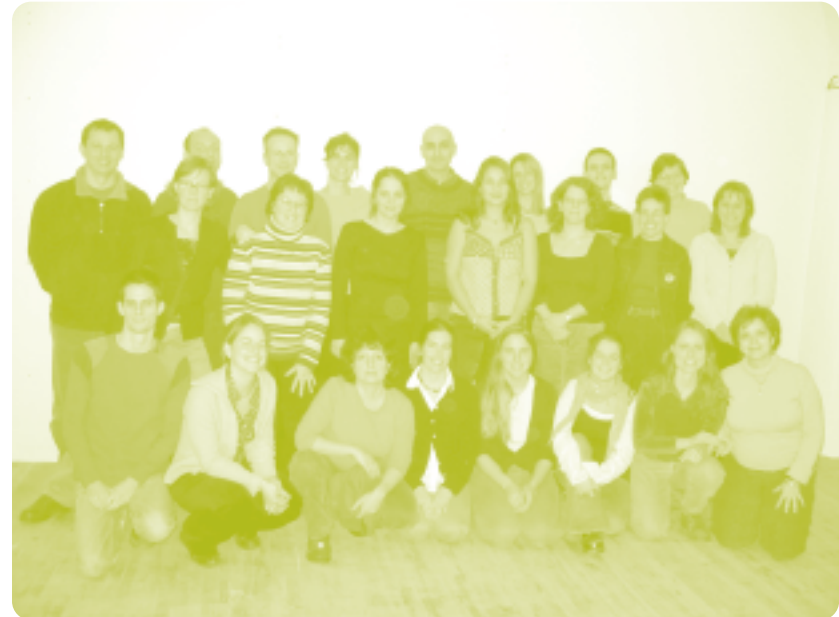
L'équipe d'Équiterre 2003

D'ici 2012, Équiterre veut devenir un « leader d'un mouvement faisant du Québec une société exemplaire en ce qui concerne les choix écologiques et socialement équitables ».